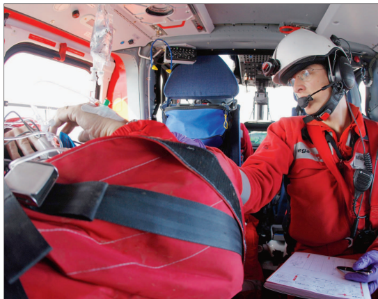
Durant le vol vers l'hôpital, le médecin urgentiste Rega prend soin du patient.

Et cette évolution se poursuit positivement, puisqu'en 2010, la Rega a enregistré 84000 nouveaux donateurs-trices, une hausse de 3,8%, soit l'équivalent du nombre d'habitants de la ville de Saint-Gall et Bulle réunis! La Suisse romande, de son côté, fait