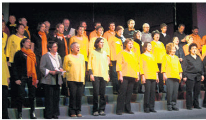
Le Chœur mixte de Thierrens prépare ses soirées spectacles d'arrache-pied.